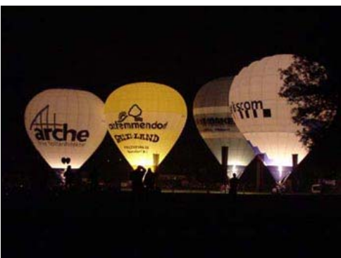
... und das Gloomig der Heissluft-Ballone.