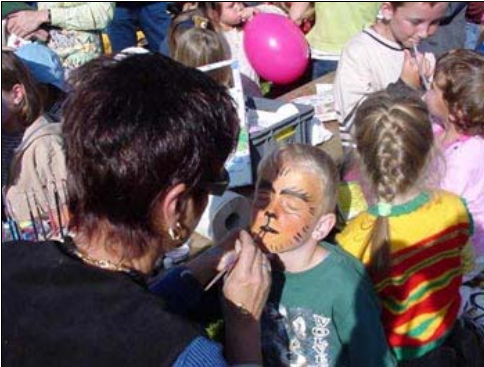
Der Zustrom war grösser denn je.

Traditionsgemäss ist während der Ballonwoche am Mittwoch auch der Ballon-Kinder-Nachmittag.