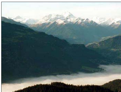
Wohl hat es in den Tälern noch etwas Morgennebel...