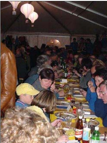
... und diese fanden sich zahlreich im Festzelt ein.