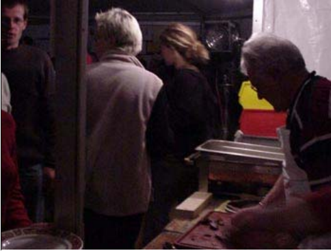
Der Hirschrücken zum Nachtessen war ein echter Schmaus für Gourmands...