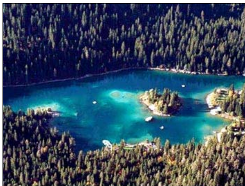
... dieser löst sich aber rasch auf ... ... und schon bald erstrahlt der Caumasee in gewohnter Farbenpracht.