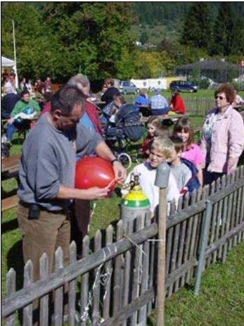
Und da der Fessel-Ballon-Aufstieg starken Bodenwinden zum Opfer fiel, wurden umso mehr Träume, eine Ballonfahrt durch den Weiffahrt-Wettbewerb zu gewinnen, an die farbigen Kinderballone gehängt.