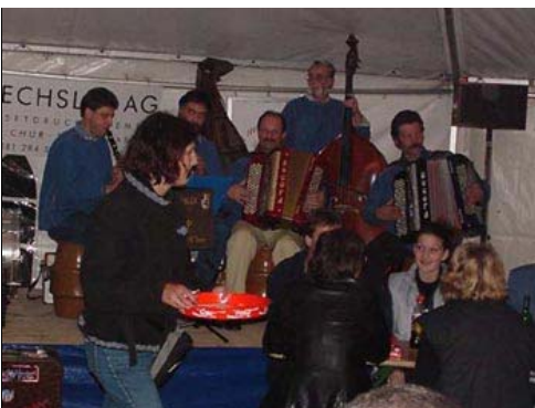
Sie schätzten nicht nur das fantastische Essen, sondern auch die Unterhaltung durch die Kapelle Oberalp, das erste Filmer Glockenspiel, natürlich die Zylindermusik,...