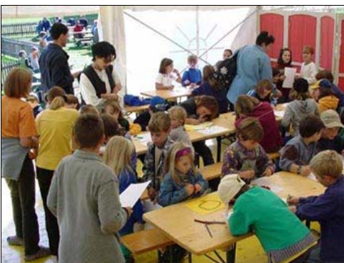
Auch am Malwettbewerb beteiligten sich viele Kinder mit sehr grossem Eifer...